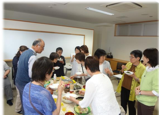
第二部の懇親会。手作り料理を楽しみながらだと、会話もどンドン弾みます