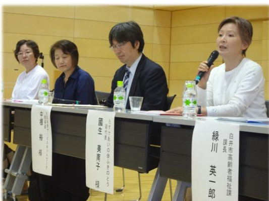
パネリストの言葉は、それぞれご自身の活動を通じた実感に裏付けられていて、とても説得力があります